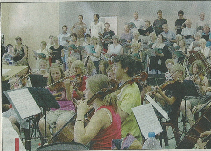
Cinquante-cinq choristes et l'orchestre du LJO en répétition.