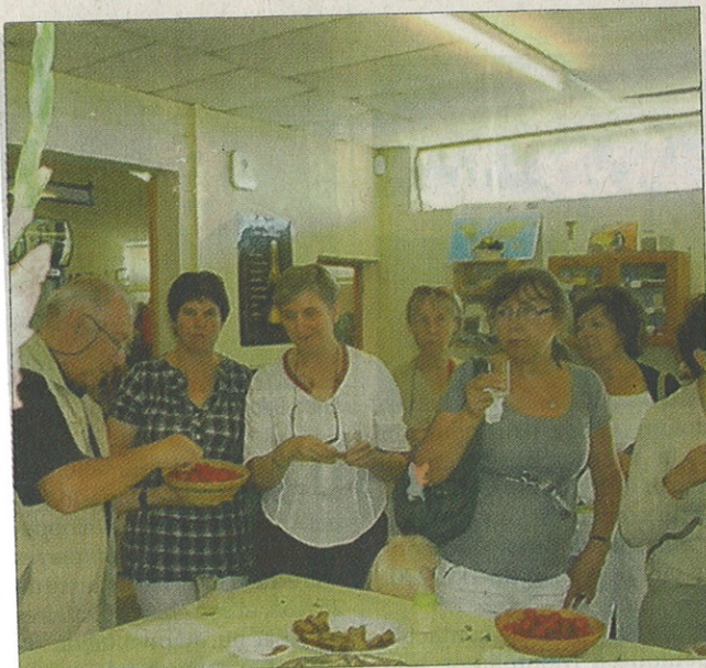
Un apéritif a été servi aux passionnés de musique.